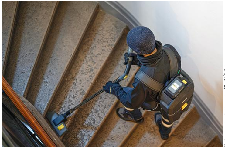
© Guillaume J. Pflison pour l'INRS/2025

📷 Le travail de nettoyage dans les escaliers présente un risque de chute qui peut être limité en améliorant l'organisation du travail, les EPI et le matériel.