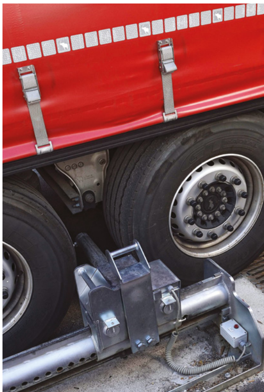
■ Dispositif de calage de roue évitant le départ intempestif du véhicule.