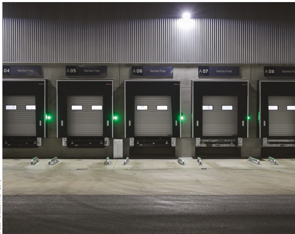
■ Quais équipés de guide-roue.