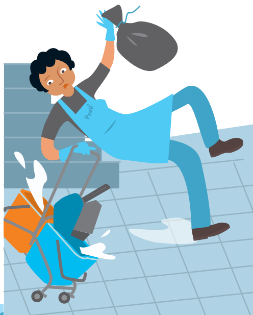
CHUTES ET GLISSADES