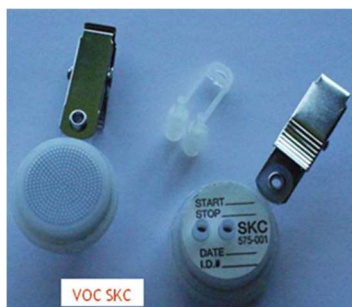
Badges SKC pour COV