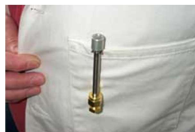
Dispositif de type B porté