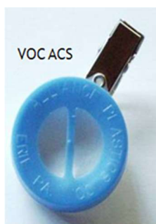
Badge ACS pour COV

Les dispositifs de type A, dont les modèles les plus courants sont présentés sur la figure 2, leur désorption se fait avec un solvant.